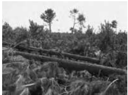
写真-1 津波被害を受けた海岸クロマツ林 (2011年, 宮城県東松島市)

宮城県には日本三景の松島があり、松くい虫対策の重点地域となっている。ちなみに、松島のマツは基本的にアカマツで、「海辺はクロマツ」の固定観念に支配されていた筆者がこの状況になじむのにはかなり時間がかかった。松島の東に連なる海岸線、また南に広がる仙台平野の長大な砂浜海岸にはクロマツの海岸林が広がっていたが、2011年3月の東日本大震災津波で大きな被害を受けた（写真-1）。津波により、ほとんどのマツがなぎ倒されたり押し流されたりしたようなイメージがあるかもしれないが、実際には相当な数のマツが津波に耐えて残った。しかし、そのような残存マツの一部（特にアカマツ）で、被災数ヶ月後から塩害によると見られる衰弱・枯死が見られるようになった 3) 。本来松くい虫で枯れた訳でないこれらのマツにはマツノザイセンチュウが生息していないので、感染源にはならないと想定していたのだが、衰弱時期が夏にかかったマツには周辺からマツノダガラカミキリ成虫が飛来して産卵し、さらに産卵痕経由で感染したとみられるマ