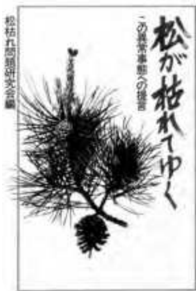
第1図 『松が枯れてゆく』表紙