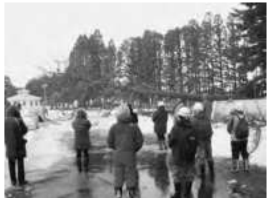
写真－6 青森県蓬田村で発見されたクロマツ被害木の伐倒処理（2010年）