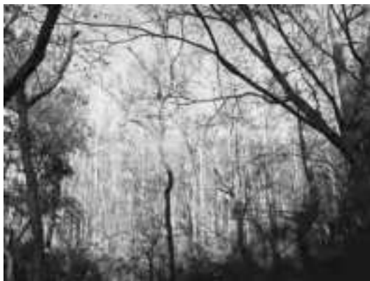
写真-4 岩手県紫波町のアカマツ林で発生した激しい松くい虫被害 (2011年)

近年の松くい虫被害拡大に対応すべく、岩手県では2012年以降、被害北限地域に航空写真を活用した被害木探査を導入した。赤外線写真(写真-5)の併用や写真画像のデジタルオルソ化により、地上探査とは比べものにならない精度で、ヘリ探査より格段に自由度が高い被害木探査ができ、しかも写真上で探した被害木の位置(緯度、経度)まで特定できるという先進的な手法である 8) 。初年度に、当時被害先端に近いと考えられていた盛岡市南部の丘陵地を撮影したところ、地上調査で数十本の被害しか報告されていなかった区域で数百本の被害木らしき樹冠が確認されて驚愕した(ただしこの中には、雪害木や駆除対象にならない古い被害木も含まれる)。地形の複雑な場所での地上調査の限界を思い知らされるとも