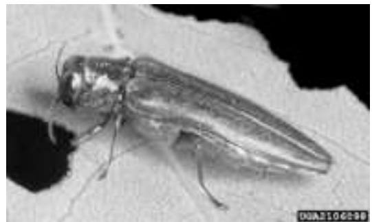
写真1 EAB (アオナガタムシ) の成虫

EABの成虫は体長10~14mm, 青緑色で金属光沢がある (写真1)。自然分布は日本, 中国北部, モンゴル, 極東ロシア, 朝鮮半島などのアジア東部。日本ではヤチダモ ( Fraxinus mandshurica ), オニグルミ ( Juglans mandshurica var. sachalinensis ), サワグルミ ( Pterocarya rhoifolia ), ハルニレ ( Ulmus davidiana var. japonica ) を食樹とし, 北海道から九州, 対馬と広く分布するが稀少で, 熊本県では絶滅危惧Ⅱ類に指定されている (Haack et al. 2002; 横原 2014)。EABについては, 日本も含め原産地における情報がほとんど無いが, 侵入先である北米では, 2002年に初めて被害が確認されて以来, 生態や防除に関する幅広い研究が精力的に続けられている (Hermes and McCullough 2014)。本稿ではこれらの成果を紹介して, EABのような希少な昆虫が持つ害虫としてのポテンシャルに注意を促したい。