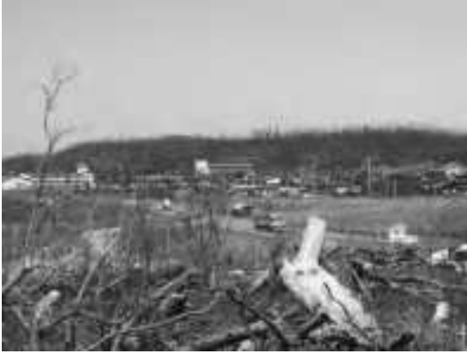
写真-2 秋田市下浜地区のクロマツ林に発生した激しい松くい虫被害 (2005年)