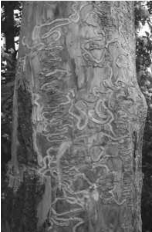
写真2 EAB (アオナガタマムシ) 幼虫の食害痕

しており、トネリコ属以外の樹種では成虫の飛来数も産卵数も少なく、幼虫も発育できない (Anulewicz et al. 2008)。合衆国本土に分布するトネリコ属の在来種は16種で (Wallander 2008)、これまでにEABの加害を受けた種はすべて感受性である (Anulewicz et al. 2007; Rebek et al. 2008)。街路樹や人為的な環状剥皮などによってストレスを受けている木では、EAB成虫が多数誘引され、樹体内の幼虫密度も高く、幼虫生存率も高くなる (Jennings et al. 2014; McCullough et al. 2009b; Tluczek et al. 2011)。しかし、EABは健全木にも加害して繁殖しており (Cappaert et al. 2005)、ミシガン州デトロイト付近の38の林分では直径2.5 cm以上のトネリコ類の累積枯死率が99%以上に達している (Klooster et al. 2014)。