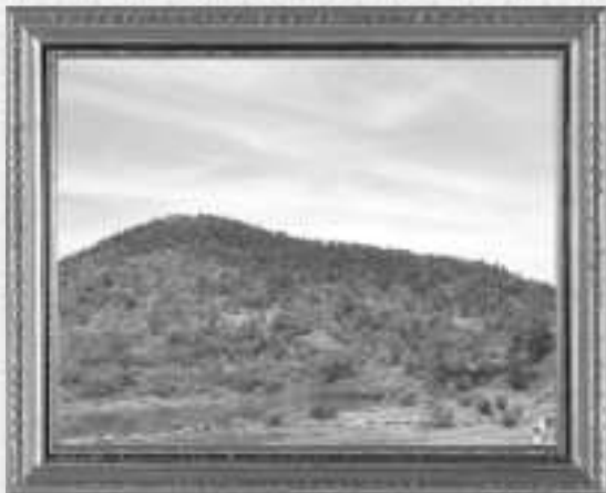
題名 放置竹林から里山を守る!