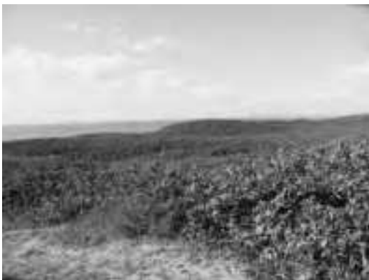
写真－3 カシワの海岸林（青森県つがる市）

岩手県に松くい虫被害が侵入したのは1979年のことで、その時点で北上盆地の幹線道路沿いに盛