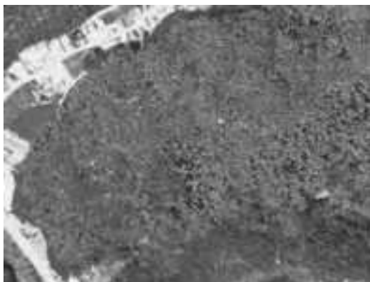
写真-5 盛岡市近郊アカマツ林の赤外線航空写真 (2014年10月撮影) 白黒写真で枯死木が白く目立つように色調を補正してある。

に、この精度の被害木探査をもとに行われてきた伐倒駆除で日本の松くい虫被害が収まらなかったのはむしろやむを得ないことだったと実感した。航空写真が暴き出した真の被害木分布に基づき、高度な防除が展開されて被害分布北限が押し下げられることを期待している。