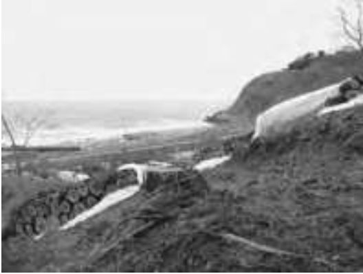
写真-7 青森県深浦町に設置された「防除帯」伐倒丸太を被覆していた生分解性シートが破損しつつある。

から、松くい虫侵入の危険性が最も高いと考えられていたのが、隣接する秋田県の被害分布北限に近い県西南部の深浦町（旧岩崎村）である。上述の県内マツノマダラカミキリモニタリング調査でも、この地域では1999年以降毎年成虫が捕獲されていた。一方、筆者らは2007年～2011年に行ったプロジェクト研究の中で 9) 、この地域を含む青森県内にマツノマダラカミキリが定着している可能性は非常に低く、また2009年に当地で捕獲されたマツノマダラカミキリ成虫についてDNA分析により秋田県産個体群に由来する可能性が高いことを示した。これらのことから、深浦町で誘引捕獲されるマツノマダラカミキリ成虫は秋田県側の被害地から飛来しているものと考えてよい。