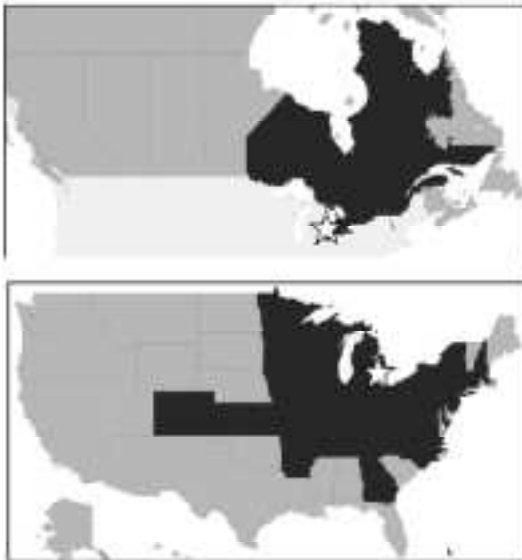
図 2014年9月までにEAB(アオナガタムシ)が発見された州(黒色, USDA APHIS 2014aに基づき作図) 上: カナダ, 下: アメリカ合衆国, ☆: 2002年に初めてEABが発見された地域

ミシガン州で発生した被害木を対象に行われた年輪年代測定の結果、1997年にはEABによる枯死が発生していたことがわかった(Siegert et al. 2014)。EABが林分に定着してから枯死被害が発生するまでに4年前後かかること(McCullough and Mercader 2012)から、EABは1990年代初め以前に定着していたと考えられている。遺伝子